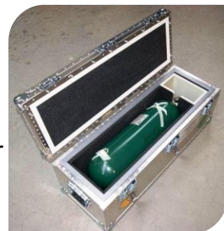
Projet de valise navette

Nous envisageons de reprendre la production de conteneurs multigaz (Kr-85 / Xe-127 / Xe-133) .